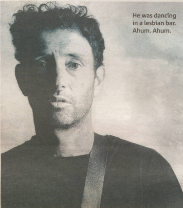
He was dancing in a lesbian bar. Ahum. Ahum.