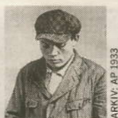
van der Lubbe.

serna mellan landsförräderi och kritik mot regeringen suddades ut. I december dömdes van der Lubbe till döden medan några ledande kommunister frikändes. Domen verkställdes i januari 1934. Men frågan om vem som anlagt branden har förblivit obesvarad. Var det nazisterna själva? Ingående käll-